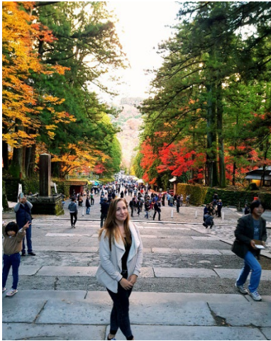
日光のきれいな紅葉