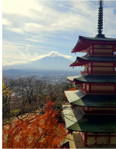
忠霊塔から見える景色(富士吉田)

その中でも最高の旅行は沖縄だったと思います。人々のエネルギーで優しいところが大好きになりました。そして、東京に比べて、建物の様式もすごく違って面白いです。時々私はもう日本にいないような感じがしました。沖縄の渡嘉敷島で初めて海で泳いだり、シュノーケリングをしながらきれいな魚を見たり、国際通りで本当に美味しい沖縄のソーキそばを食べてみました。その旅行は忘れられない思い出になりました。