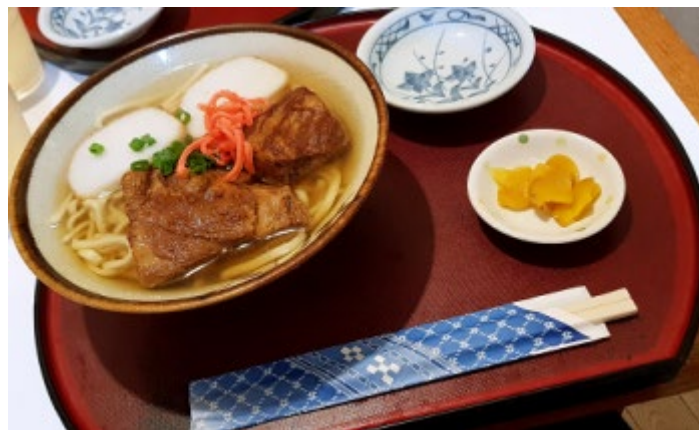
世界が一番美味しい料理、ソーキそばですよ！

その中でも最高の旅行は沖縄だったと思います。人々のエネルギーで優しいところが大好きになりました。そして、東京に比べて、建物の様式もすごく違って面白いです。時々私はもう日本にいないような感じがしました。沖縄の渡嘉敷島で初めて海で泳いだり、シュノーケリングをしながらきれいな魚を見たり、国際通りで本当に美味しい沖縄のソーキそばを食べてみました。その旅行は忘れられない思い出になりました。