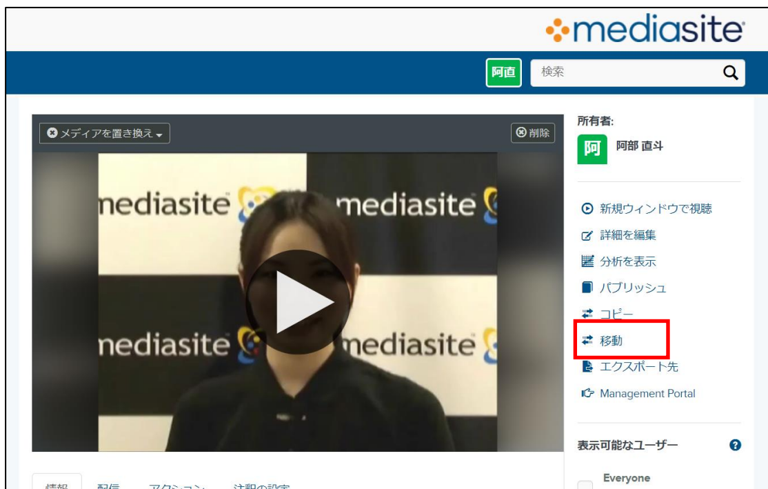
コンテンツの移動画面