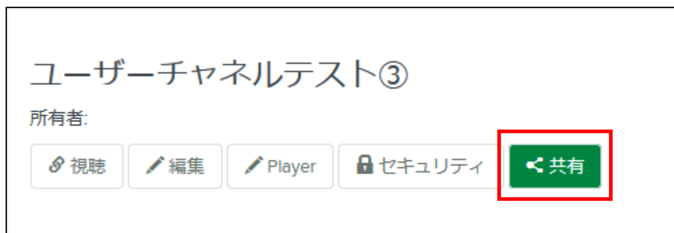
チャンネルの共有 画面