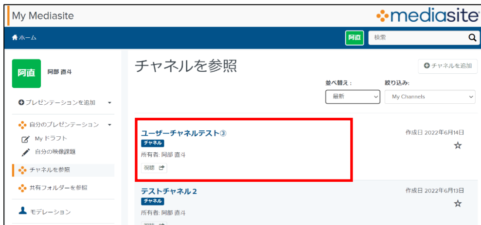
チャンネルを参照 画面