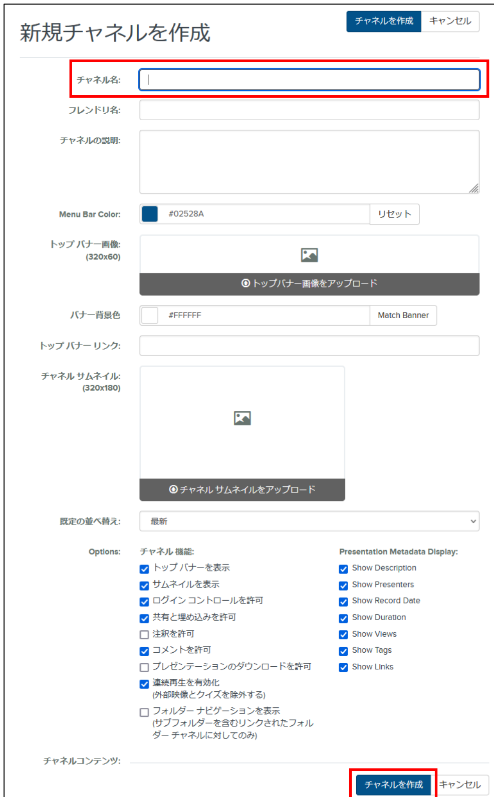
新規チャンネルを作成画面

3. 「チャンネル名」を入力します。任意で説明などを記載し、「チャンネルを作成」をクリックします。