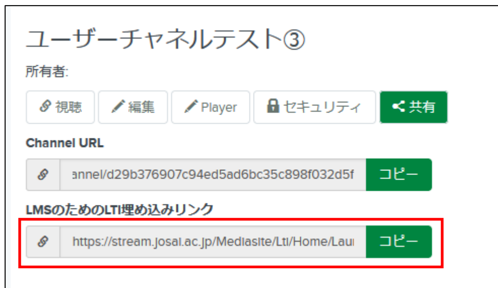
LMS のための LTI 埋め込みリンク 画面