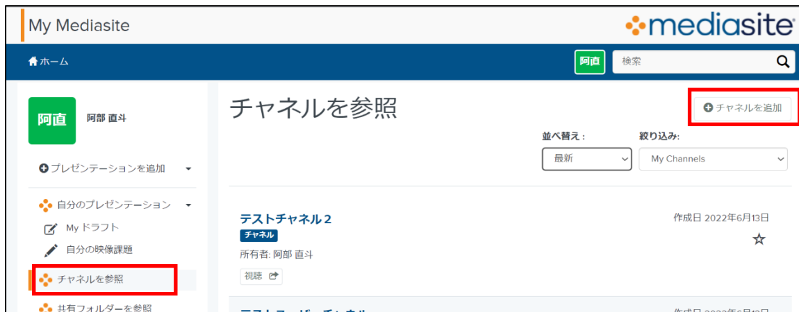
チャンネルを参照 画面